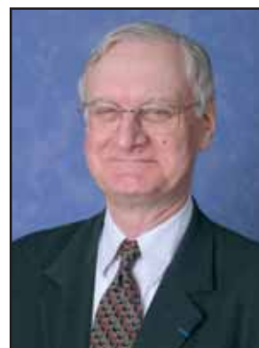
Conseiller municipal délégué à l'urbanisme et aux grands travaux.